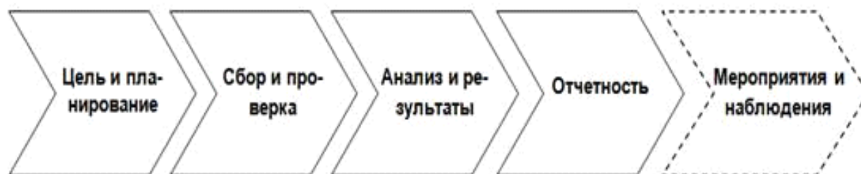
Рисунок 1. Модель методологии бенчмаркинга энергоэффективности (разработано автором)

Модель методологии бенчмаркинга энергоэффективности стандарта EN 16231 приведена на рис. 1.