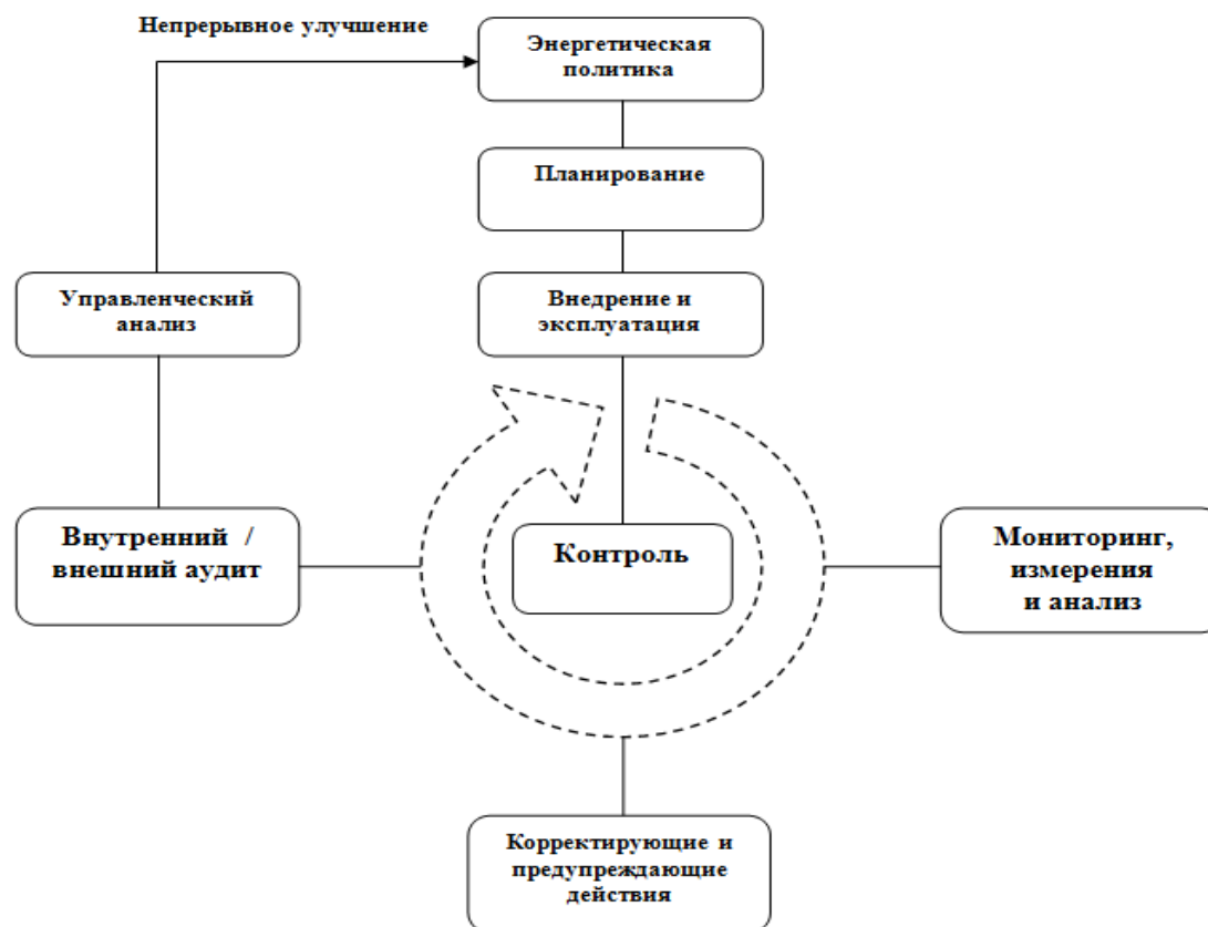
Рисунок 3. Модель системы энергетического менеджмента (разработано автором)

сделан в системе энергоменеджмента организации. Использование энергии в промышленности может оцениваться согласно функциональной схеме, приведенной на рис. 3 [65].