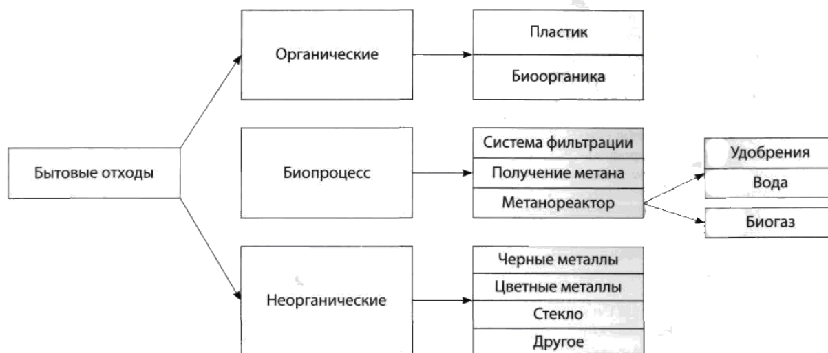
Рисунок 1. Технологическая схема процесса переработки ТБО (разработано автором)

Технология применяемая в г. Хильдесхайм (Германия) (см. рис. 1).