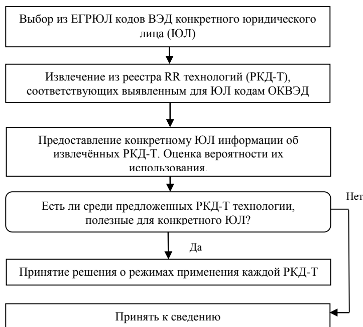
Рисунок 3. Схема функционирования процедур предоставления информации о РКД-Т для ЮЛ.

Приведённые схемы указывают путь, который должны пройти ЛПП или юридические лица (ЮЛ) для выявления потенциально пригодных для их деятельности РКД-Т. Такая процедура выполняется 1 раз и повторяется для ЮЛ при смене или расширении сферы деятельности, а для ЛПП – при смене или расширении выполняемых функций. Так же процедура повторяется, если RR расширяется.