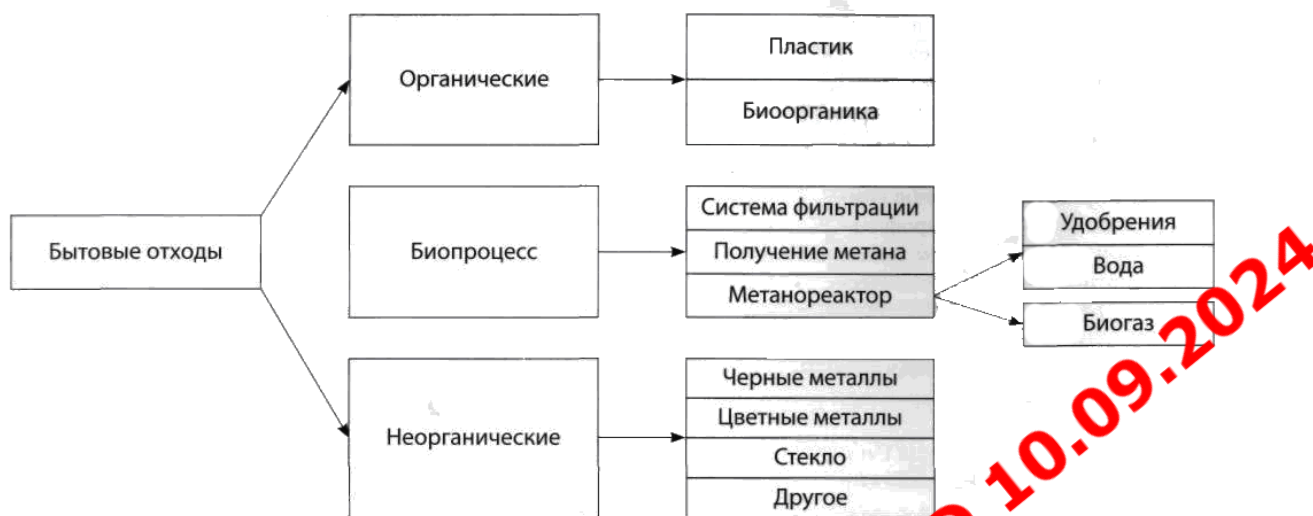
Рисунок 1. Технологическая схема процесса переработки ТБО (разработано автором)

Технология применяемая в г. Хильдесхайм (Германия) (см. рис. 1).