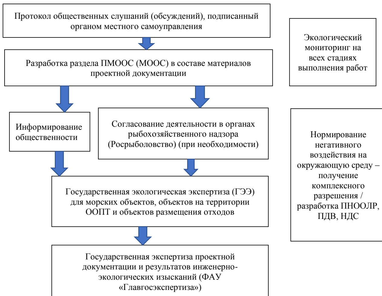
Рисунок 1. Алгоритм и виды работ при оценке воздействия на окружающую среду (составлено авторами)

В настоящее время основным нормативным документом Российской Федерации, в котором прописаны все этапы общественного участия в процедуре ОВОС, является Приказ Госкомэкологии РФ от 16 мая 2000 г. N 372 «Об утверждении Положения об оценке воздействия намечаемой хозяйственной и иной деятельности на окружающую среду в Российской Федерации» (далее по тексту – Положение об ОВОС).