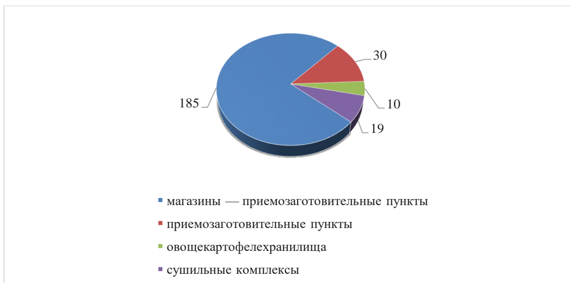
Рисунок 2. Предприятия, осуществляющие заготовительную деятельность (составлено автором по https://www.audit-it.ru/buh_otchet/0274032117_bashkirskiy-respublikanskiy-soyuz-potrebitejskikh-obshchestv )

Заготовительная отрасль потребительской кооперации республики Башкортостан представлена 30-ю приёмно-заготовительными пунктами, 185-ю магазинами формата «магазин — приёмно-заготовительный пункт», 10-ю овощекартофелехранилищами общей мощностью 5 000 тонн закладки, 19-ю сушильными комплексами, рисунок 2.