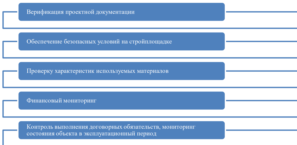
Рисунок 1. Направления технического аудита (разработано авторами)

В дальнейшем происходит формирование информационной базы: накопление технической документации по проекту, сведений о движении транспорта, параметров используемых строительных материалов и результатов ранее проведенных проверок.