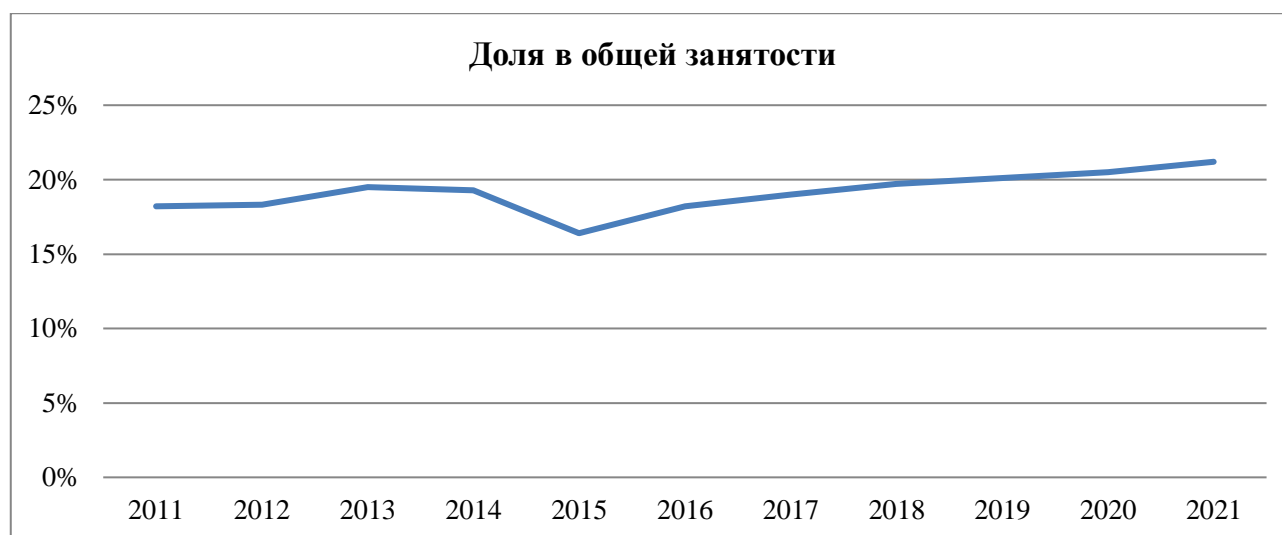
Рисунок 5. Доля занятых работников в неформальном секторе с 2011 по 2021 годы [13]

На графике ниже представлены данные о занятых работниках в неофициальном секторе экономики за период с 2011 по 2021 годы. По сравнению с 2020 годом неформальный сектор увеличился более чем на полмиллиона человек. Он непрерывно растет с 2016 года и за это время увеличился на 4 млн человек (рис. 5).