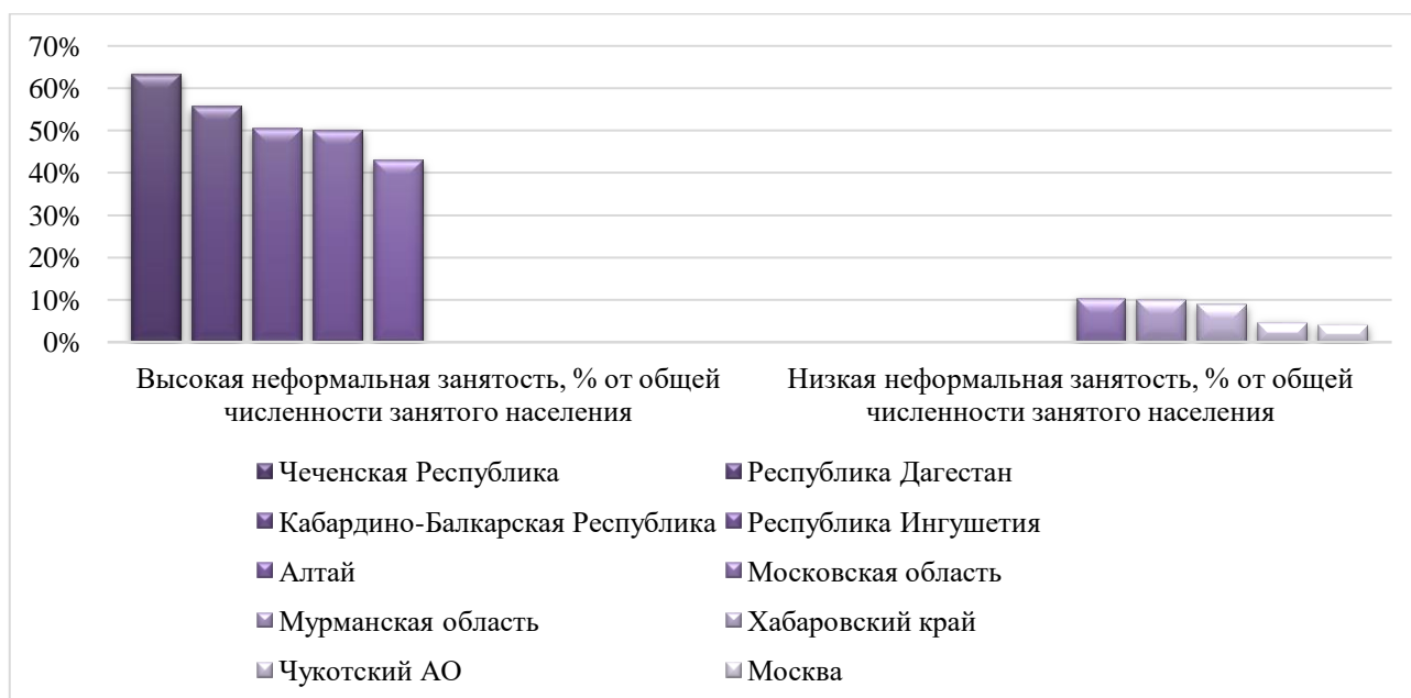
Рисунок 4. Регионы с самой высокой и самой низкой неформальной занятостью [12]

По данным за 2021 год наблюдается неравномерность распределения теневой экономической деятельности в России. Показатели доказывают влияние на масштабы теневой экономики таких аспектов как уровень жизни населения, культурные и этнические традиции и ценности, нестабильность управления местных финансово-контрольных и правоохранительных систем (рис. 3).