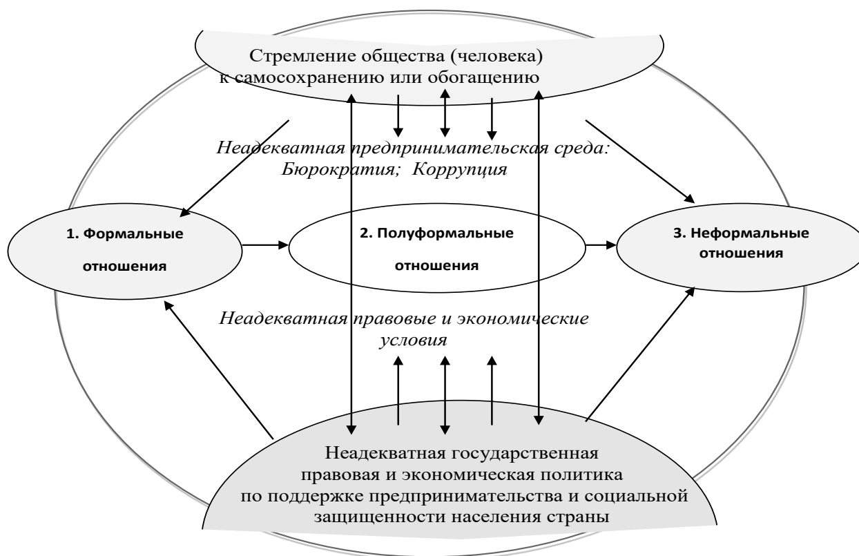
Рисунок 1. Механизм, раскрывающий объективность существования теневой экономики [10]

На основе вышеизложенного можно сделать вывод что главной движущей силой роста теневого сектора являются — не рациональная экономическая политика государства (в том числе налоговая, административно-правовая и социально-экономическая) и стремление людей к сохранению и приумножению собственных благ. Данную взаимосвязь первопричин формирования теневой экономики можно представить в виде схемы (рис. 1).