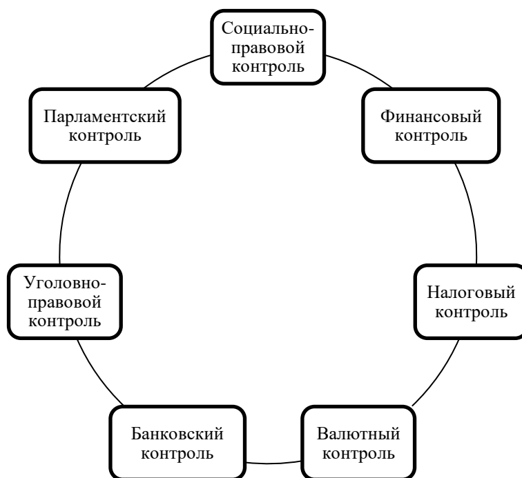
Рисунок 2. Инструменты государственного контроля [10]

Государственный контроль над теневой экономикой осуществляется с помощью следующих взаимозависимых инструментов (рис. 2).