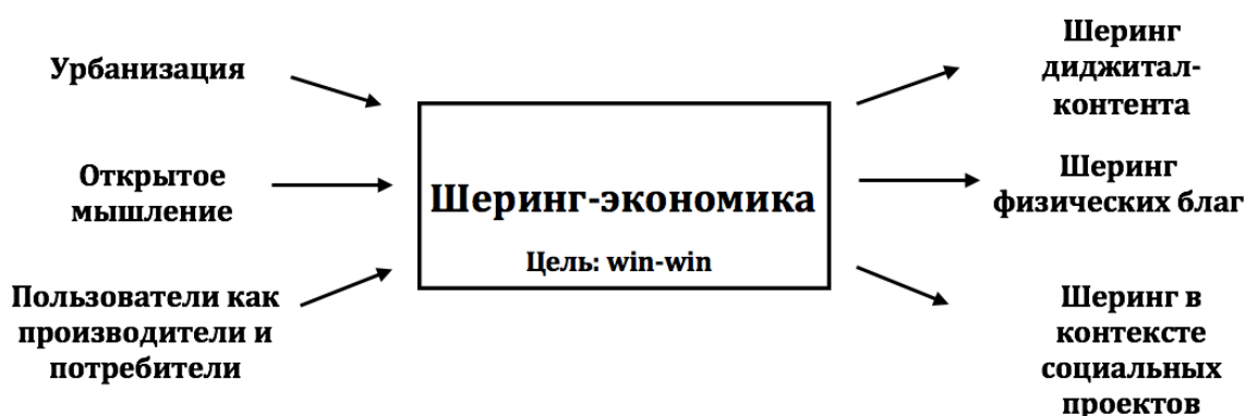
Рисунок 1. Модель экономики обмена [9]

Рассматривая бизнес-модель шеринг-экономики, можно прийти к выводу, что она является действительно уникальной и не имеет аналогов, за счет своих ценностей и принципов для окружающей среды, которые объединяют экономическое, социальное и экологическое начало, воздействуя комплексно всем спектром характерных эффектов (рис. 1).